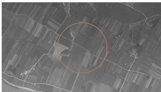
Les traces de l'emplacement du fort Chagnaud sur une vue aérienne de 1937.