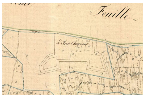
La partie sud de l'emplacement du fort Chagnaud sur le plan cadastral de Saint-Nazaire-sur-Charente de 1824, section D1.