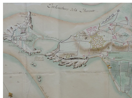
Projet d'un fort citadelle par Hecker de Vialis en 1779 ; l'emplacement est celui attesté par les traces de l'ouvrage.