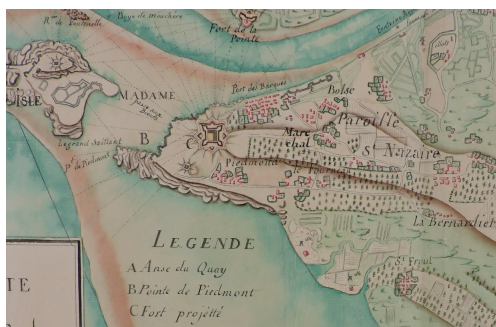
Avant-projet du fort - plus à l'ouest - sur une carte de La Rozière en 1767.