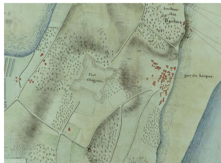
Fort chagnaud sur un plan de 1811.